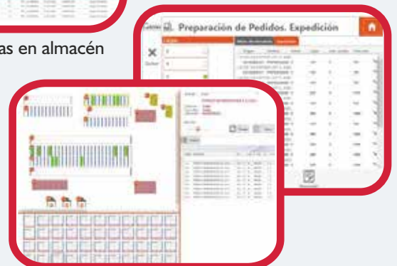
Stock en tiempo real