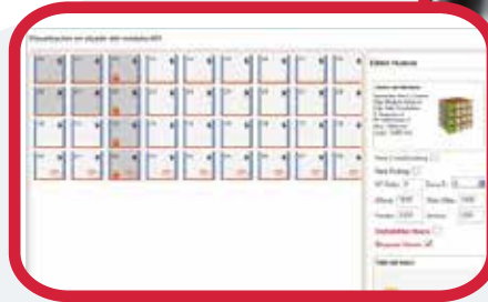
Alzado de alineación