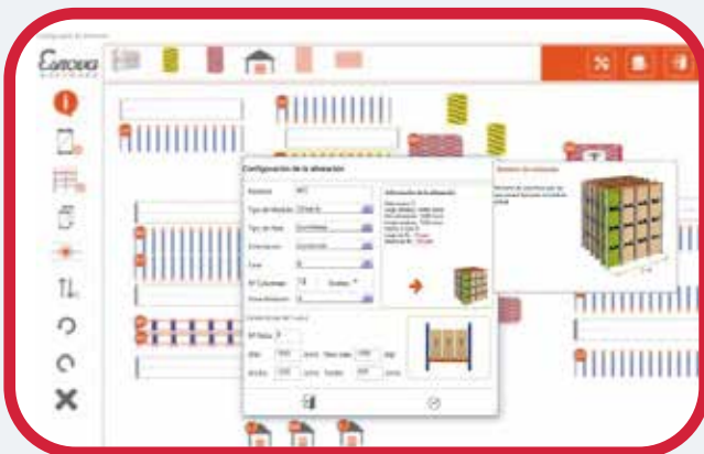
Configuración de alineaciones