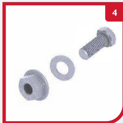
CONJ. TORNILLERÍA CT AC 615