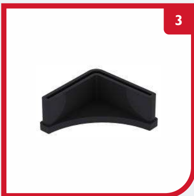
CALZO DE PLÁSTICO