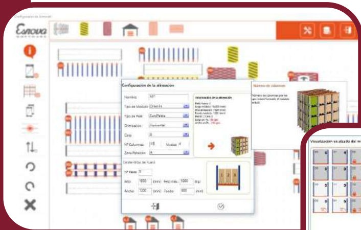
Configuración de alineaciones