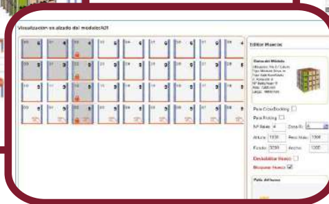
Alzado de alineación