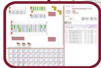
Stock en tiempo real